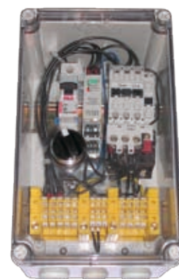
:: Защитно-управляющее устройство UZS.2