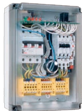
:: Защитно-управляющее устройство UZS.4