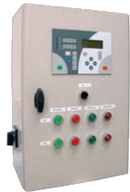
:: Защитно-управляющее устройство UZS.8