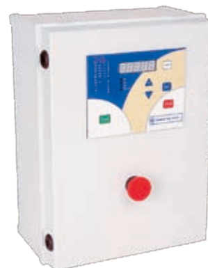
:: Защитно-управляющее устройство UZS.5