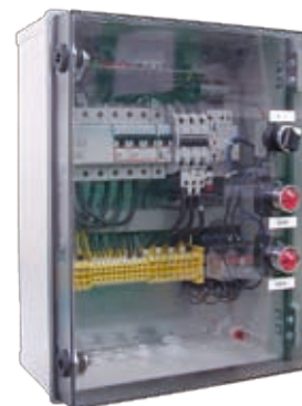
:: Urządzenie zabezpieczająco-sterujące UZS.6