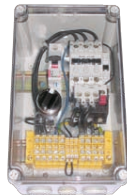
:: Защитно-управляющее устройство UZS.1