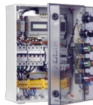
:: Защитно-управляющее устройство UZS.7